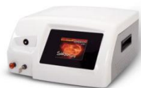
Laser urologiczny SALSA

Zabiegi wykonywane są polskim laserem diodowym firmy Cryoflex-Metrum w Oddziale Urologii Jednego Dnia Krapkowickiego Centrum Zdrowia